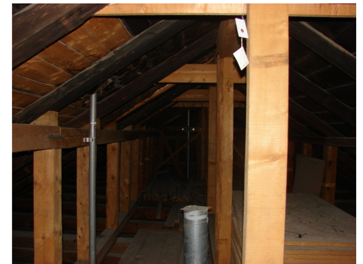
Capteur thermique et d'humidité placé à l'intérieur des combles de l'Hôtel de Ville de Tavannes. La température a atteint 37°C, le 27 juin à 15h00.

A l'inverse, les toitures ont bien rempli le rôle protecteur contre le froid, avec une température dépassant toujours d'au moins 2°C à 3°C la température extérieure. Bien agréable, d'être au « chaud » à 9°C sous une tuile faîtière alors que dehors la température est tombée à 2°C. Surtout si cela se passe début juin lorsque les jeunes viennent de naître et qu'ils sont encore tous nus! Heureusement tout de même que les petits se tiennent aussi chauds entre eux pendant que les mères vont chas-