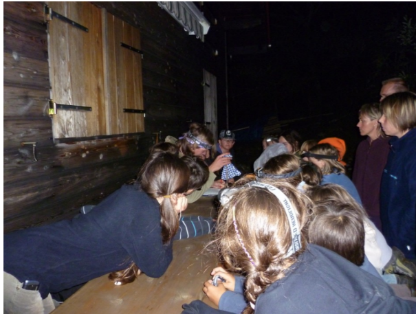
Suspense avant la sortie du pochon d'une chauve-souris venant d'être capturée à l'entrée de la grotte (Photo K. Hasler).

A la fin de l'été, les chauves-souris commencent à faire leur réserve pour passer l'hiver. C'est aussi à cette période que la plupart des espèces s'accouple. Ainsi, des inventaires à cet période permet de rencontrer beaucoup de chauves-souris venues trouver un(e) voir plusieurs partenaires pour se reproduire, mais aussi venues prospecter un logis où dormir bien au calme durant la saison morte.