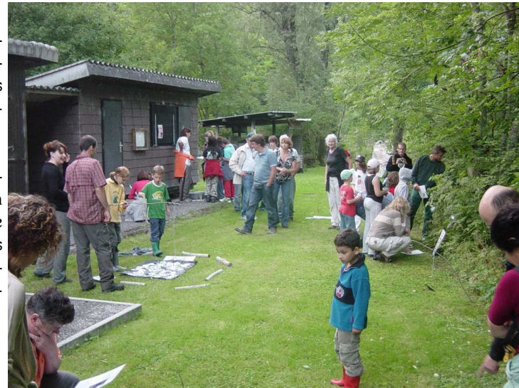
Beaucoup d'animation autour du parcours didactique spécialement conçu pour les enfants

Dans le Jura bernois, les participants ont pu réaliser de belles observations de chauves-souris en train de chasser et observer de plus près les quatre individus capturés. Parmi eux, 3 spécimens dociles et un quatrième très agressif. Son sexe ? Les participants ont parié pour une femelle ... et ont eu raison (cette fois-ci).