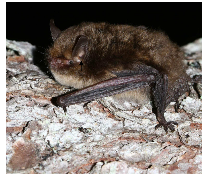
Dans la mythologie, la nymphe Alcathoe ou Alcihoe, aurait été transformée en chauve-souris suite à son refus de célébrer le culte de Dionysos.

Ces chauves-souris ont approximativement la taille d'un pouce et se distinguent entre elles par certains détails de dentition et de coloration, notamment la couleur du tragus (flèche).