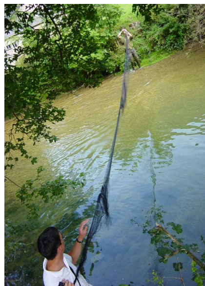
Les filets sont souvent dressés en travers des cours d'eau. La récupération des animaux capturés peut parfois être délicate ...

YL: Oui, en 20 ans les chauves-souris sont passées du stade d'affreuses bêtes à celui d'animal utile et captivant. Nous avons de plus en plus de classes d'écoles qui prennent ce thème comme support de cours sur les mammifères. Cela devient un must aussi de participer à des soirées découvertes! C'est une belle victoire qui montre que l'on a peur de ce que l'on ne connaît pas.