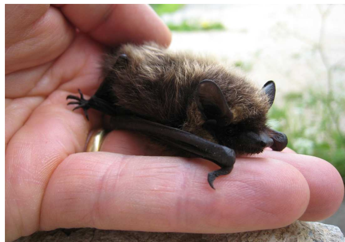
Jeune Sérotine boréale. On compte de nombreuses colonies de cette espèce dans le Vallon de St-Imier.

YL: Evidemment! Au début, il s'agissait d'abord de savoir quelles étaient les espèces présentes dans la région, comment elles se répartissaient et lesquelles se reproduisaient ici. Ensuite il a fallu organiser la protection, le conseil et l'information au public. Un énorme travail a été fait en Suisse pour faire connaître ce groupe et je crois que le pari est réussi. Aujourd'hui, il s'agit avant tout de concrétiser la mise en place des mesures, de suivre l'évolution des populations ou de répondre plus concrètement à des questions de société. Le dernier exemple en date est évidemment de