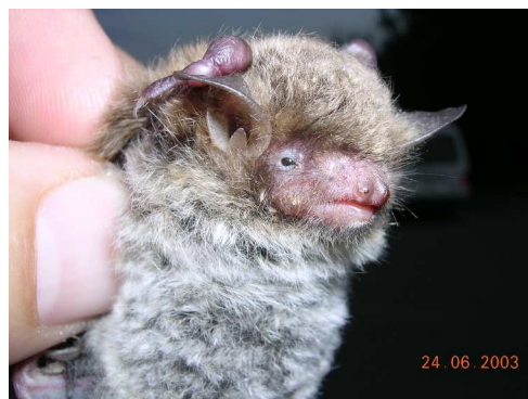
Murin de Daubenton

Rendez-vous est pris pour la prochaine nuit des chauves-souris, le 28 août 2009.